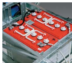
BATTERI 2 st uppladdningsbara rörplattbatterier. Kapacitet: 110 Ah/5 tim.