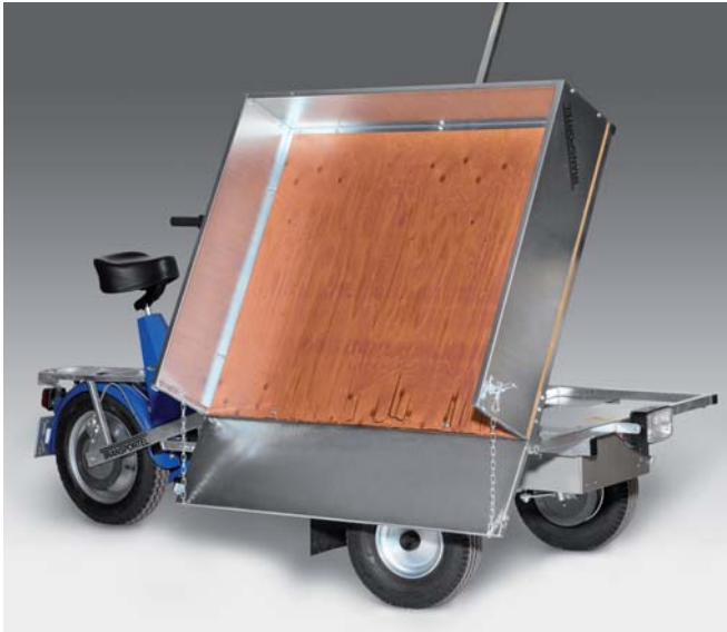
Lätt tippbart flak tack vare hjälp från gasfjäder.