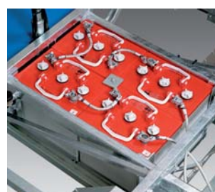
BATTERI 4 st uppladdningsbara rörplattbatterier. Kapacitet: 175 Ah/5 tim.