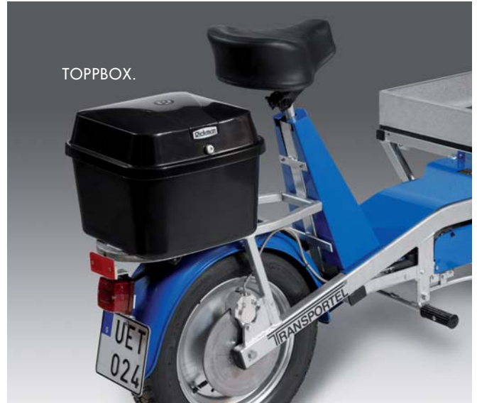
Toppbox. Läsbart förvaringsutrymme på 28 l, vattentät.