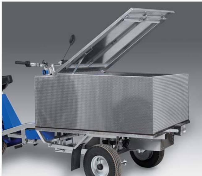
Flaklåda av aluminium med läsbart lock samt avtagbar front