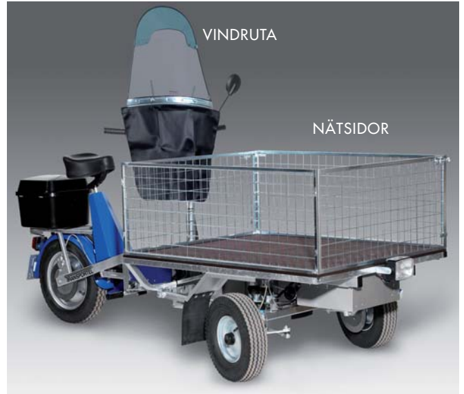
Vindruta ger bra vindsyddad förarmiljö. Nätsidor. Höjd: 450 mm