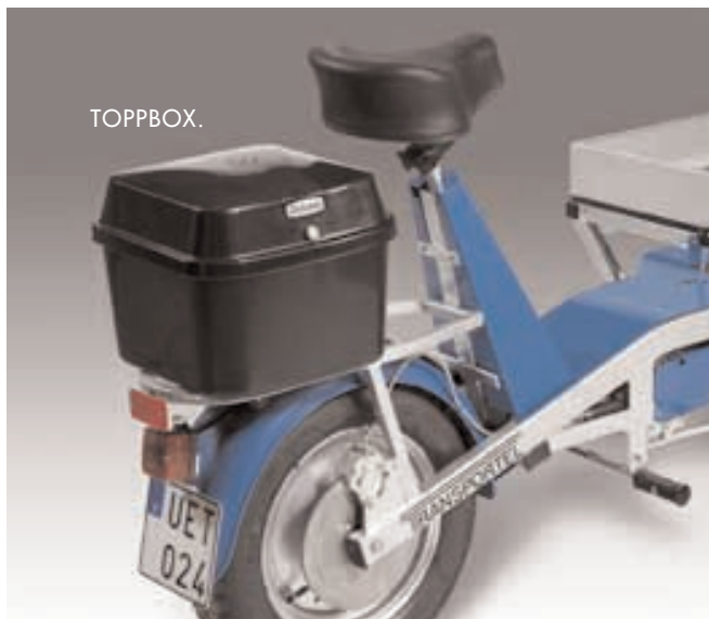
Toppbox. Låsbart förvaringsutrymme på 28 l, vattentät.