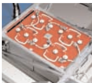
BATTERI 4 st uppladdningsbara rörplattbatterier. Kapacitet: 175 Ah/5 tim.