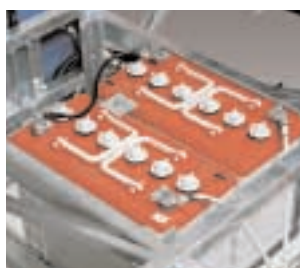
BATTERI 2 st uppladdningsbara rörplattbatterier. Kapacitet: 100 Ah/5 tim.