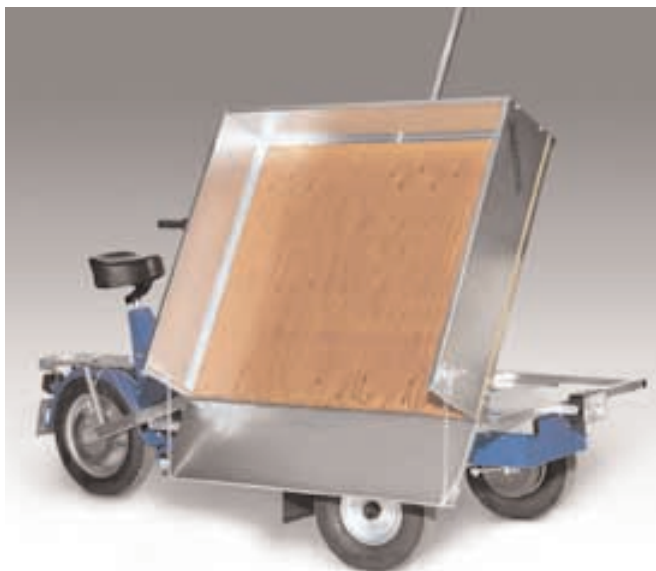
Lätt tippbart flak tack vare hjälp från gasfjäder.