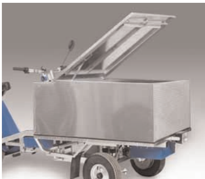
Flaklåda av aluminium med låsbart lock samt avtagbar front