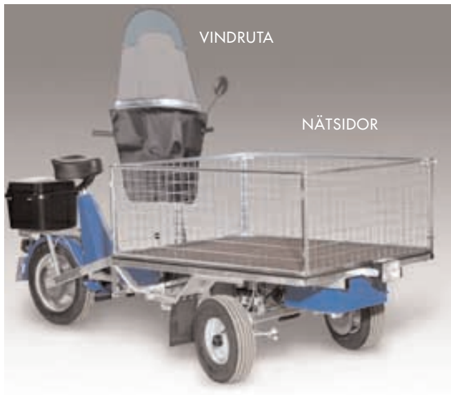
Vindruta ger bra vindsyddad förarmiljö. Nätsidor. Höjd: 450 mm